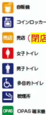
Asue アリーナ大阪 地下 2F